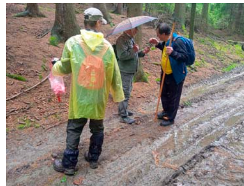
↑ Příprava tras proběhla za deště, ale na samotný pochod už bylo tradičně hezky