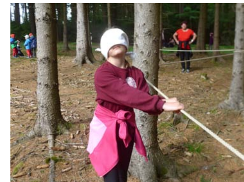
↑ Na Vilámově se mohli turisté občerstvit nebo se zabavit doprovodnými hrami