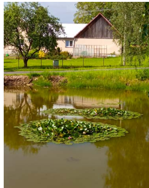
Na rybníčku ve Vesničce opět rozkvétají lekníny.