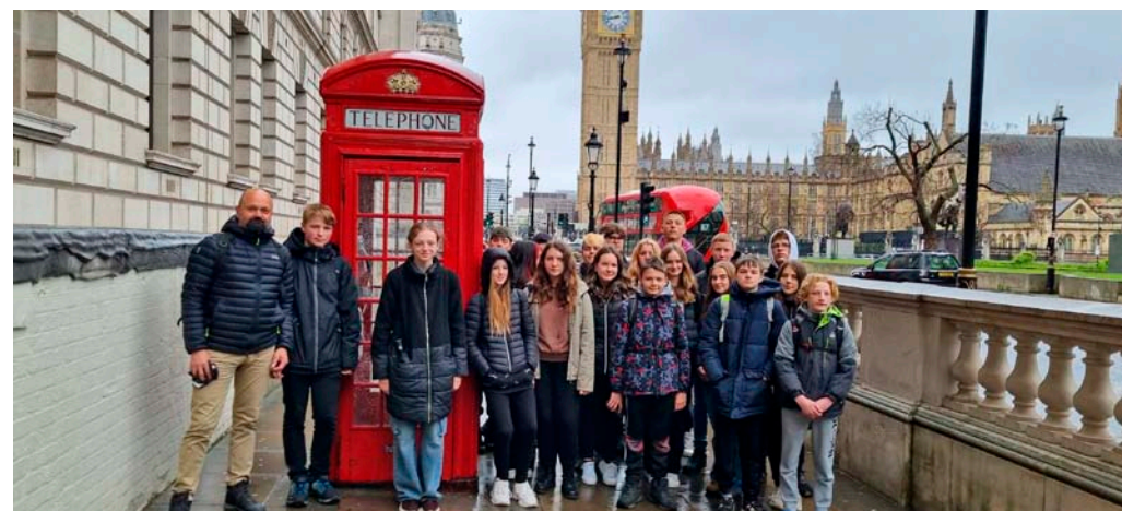
Během výletu do Londýna si žáci školy prohlédli největší pamětihodnosti britské metropole.