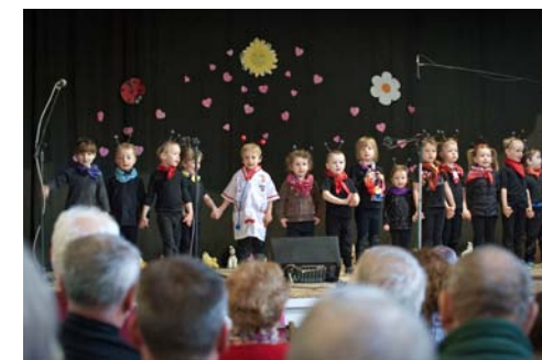
Den matek oslavila mateřská školka besídkou v sokolovně. Nejmenší děti si připravily pohádku o nemocném mravenečkovi.