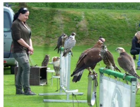
↑ Součástí programu v cíli na hřišti byla ukázka sokolnictví i nablýskaných veteránů a sportovních aut