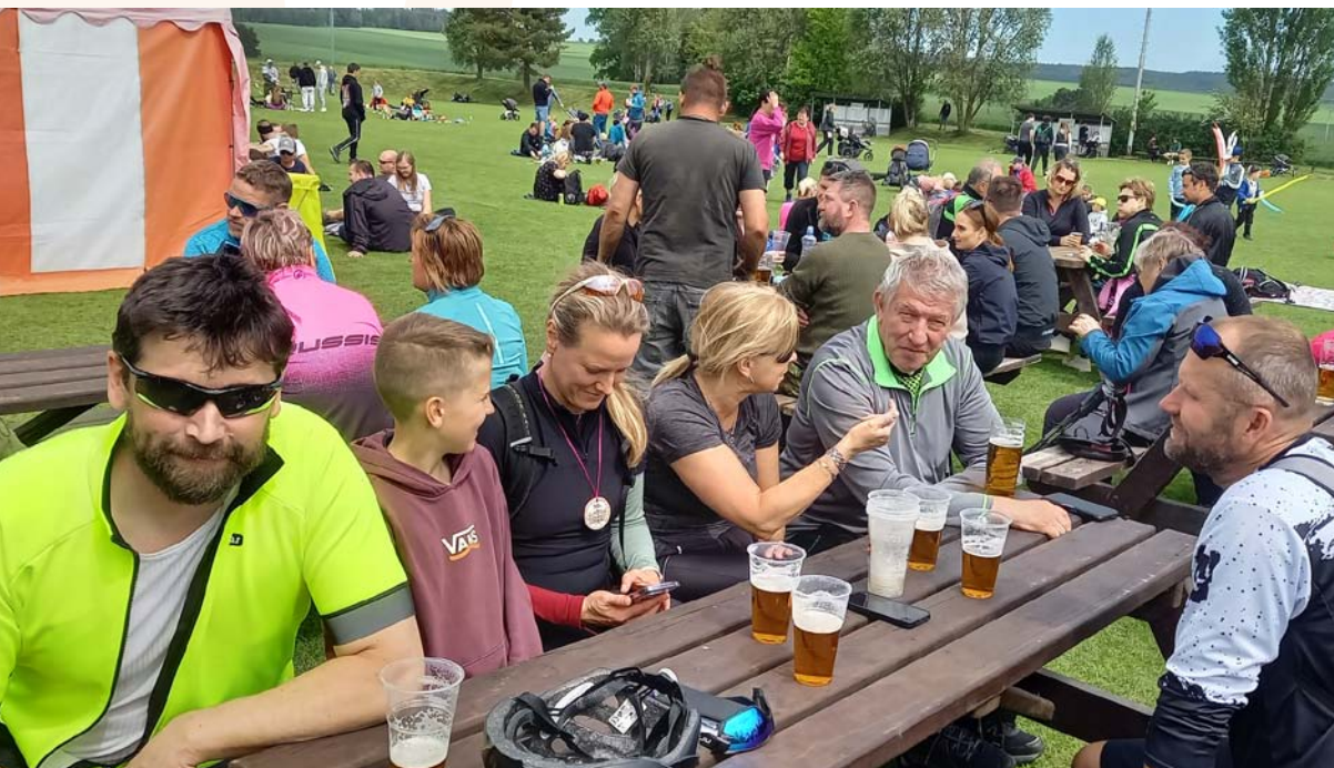
↑ Zasloužená odměna