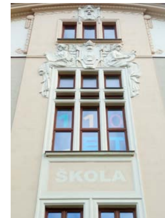
Základní škola se připravuje na oslavy 110 let od postavení školní budovy.