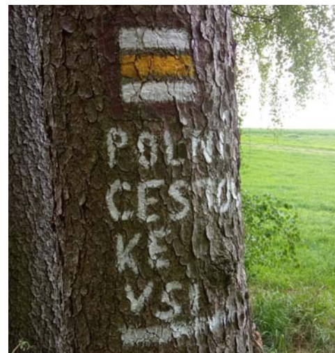
↑ ...kdyby někdo netušil, kam ho trasa zavede