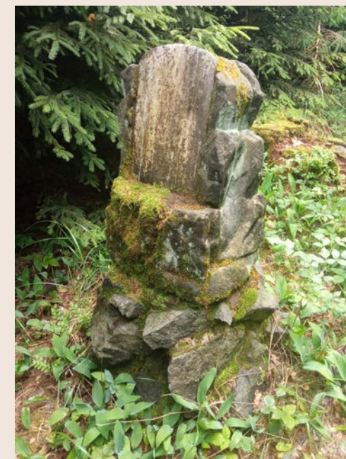
Pomník v lese v Vesničce je v současné době zanedbaný a nápis na desce nečitelný. Obec ale připravuje jeho brzkou obnovu.

Jenže doba pokročila a okruh informací se rozšiřuje, vycházejí najevo nová fakta. A tak jako se dlouho o vlasovcích nemluvalo vůbec, nyní se ukazuje, že ne vše o nich se jich ve skutečnosti týká. Neboť „praví vlasovci“ byli příslušníci Výboru (Komitétu) pro osvobození národů Ruska generála A. A. Vlasova (KONR, zjednodušeně ROA; symbolicky byl vyhlášen Manifest