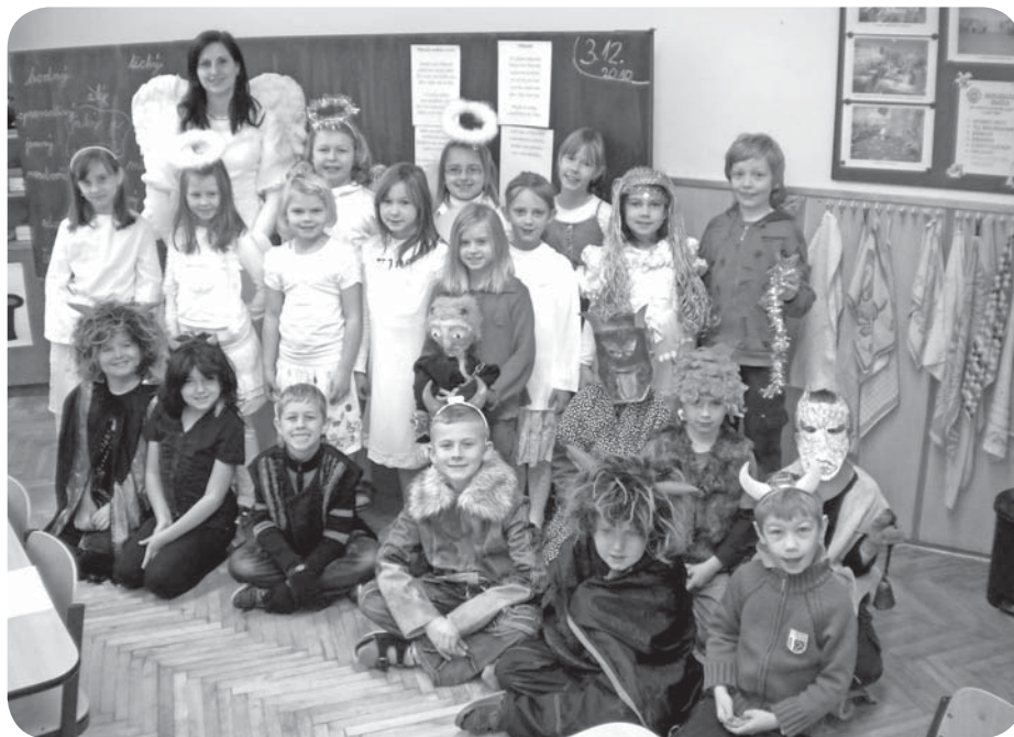
3. třída – 5. prosince 2010

Děti ze školní družiny oslavily tento den tradiční čertovskou diskotékou, kde se všichni včetně vychovatelek převlékli za pohádkové bytosti a společně si zatancovali a zahráli různé hry.