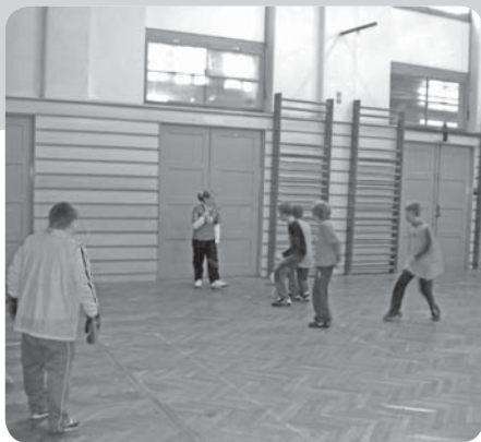
Fotbalový turnaj 1. stupně