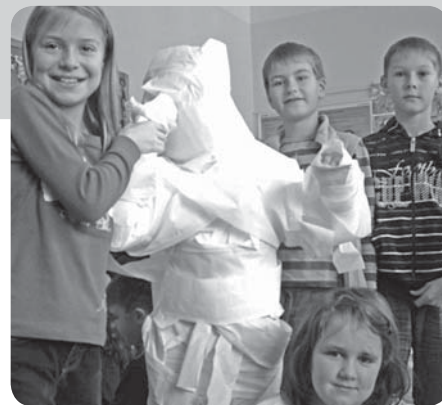
Vánoční besídka 4. třídy

Vzhledem ke stoupající finanční náročnosti lyžařského výcviku se naše škola rozhodla nakoupit lyžařské vybavení pro zájemce z řad žáků školy. Oslovili jsme několik firem s žádostí o sponzorský dar k nákupu této výbavy a jsme rádi, že téměř všichni oslovení nám přispěli. Škola tak nyní vlastní