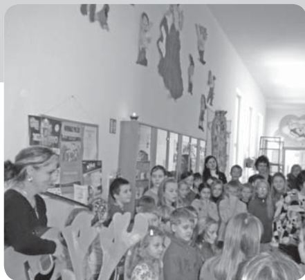
Zpívání na schodech

Předvánoční náladu jsme si zpestřili tradičním sborovým zpěvem vánočních koled a písní s vánoční tematikou. Postupně si zazpívali všichni žáci prvního i druhého stupně. Na video i fotografie ze zpívání našich žáků se můžete podívat na adrese www.zs-sloupnice.cz/aktuálně .