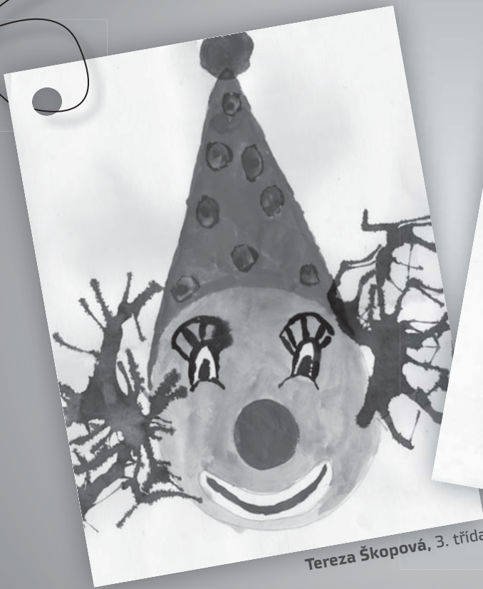
Tereza Škopová, 3. třída