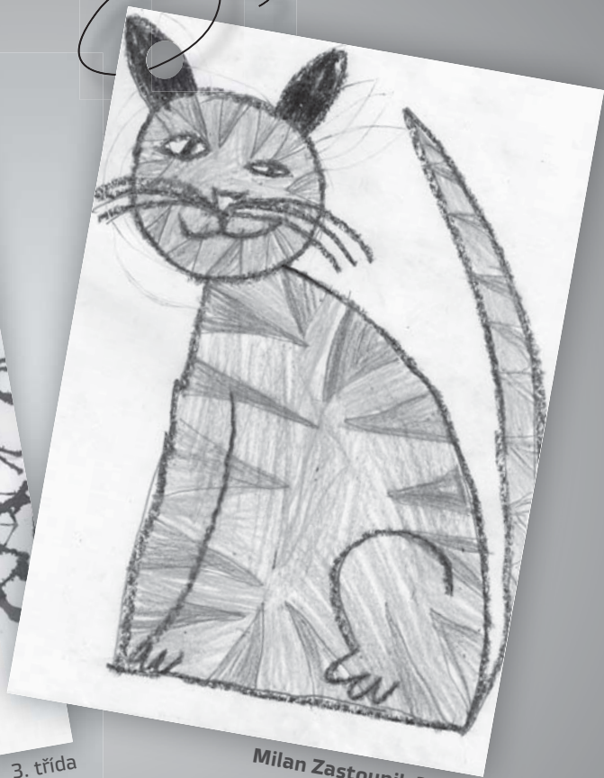
Milan Zastoupil, 3. třída