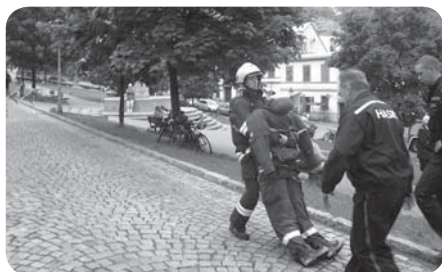
Souboj s figurínou

J: Na oficiální soutěže pořádané Hasičským záchranným sborem jezdí tak padesát, šedesát závodníků.