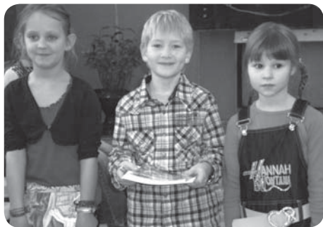
Vítězové jedné z kategorií recitační soutěže

V únoru a březnu se několik žáků z prvního i druhého stupně zúčastnilo oblastního kola přehlídky dětských recitátorů, proběhl turnaj v sudoku a školní kola přírodovědné a zeměpisné olympiády, zúčastnili jsme se litomyšlské florbalové ligy žáků 8.–9. tříd a navštívili jsme divadelní představení Ještěř v Hradci Králové. V bazénu v České Třebové se žáci 1.–4. třídy během 20 lekcí zdokonalují v plaveckých dovednostech. Všichni zájemci o dění ve škole mohou navštívit naše internetové stránky www.zs-sloupnice.cz . Přehled akcí uskutečněných školou naleznete v sekci „aktuálně“.