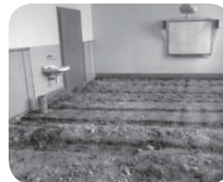
2. třída – 11. 7. 2011

Na začátku každého školního roku berou rodiče do rukou seznam pomůcek, které budou žáci potřebovat a obcházejí papírnictví a dle uvedených čísel nakupují např. sešity. Naše škola nabízí od školního roku 2011/2012 službu, která tuto povinnost usnadní. Sami jsme oslovili několik papírnictví s tím, že jsme jim předali seznamy sešitů tak, jak je požadují učitelé. Dle nabízené ceny za jednotlivé balíčky jsme vybrali nejlevnější variantu. Rodiče tak pouze předali škole souhlas, že chtějí, aby škola nakoupila sešity za ně. Půjde-li Vaše dítě v následujícím školním roce např. do třetí třídy, není již nutné shánět pro něj sešity, ale stačí odevzdat 53 Kč a balíček všech sešitů dostane dítě ve škole. Nicméně rodiče, kteří mají možnost sehnat tyto pomůcky sami, dostali jako v předchozích letech seznam potřeb pro následující školní rok.