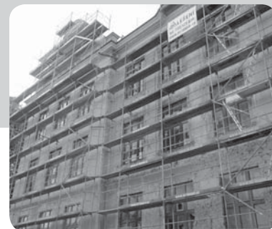
Rekonstrukce 12. 7. 2011

Situace až do letošního roku byla následující. Školní jídelna umístěná ve škole, kde jsme se stravovali jako žáci, přestala v devadesátých