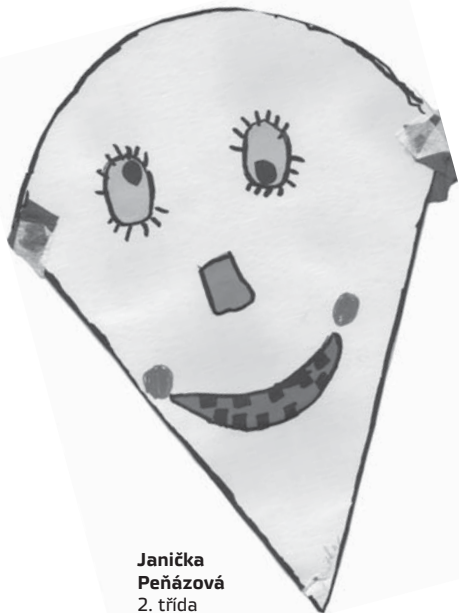
Janička Peňázová 2. třída