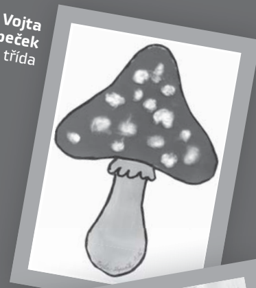
Vojta Kopeček 1. třída