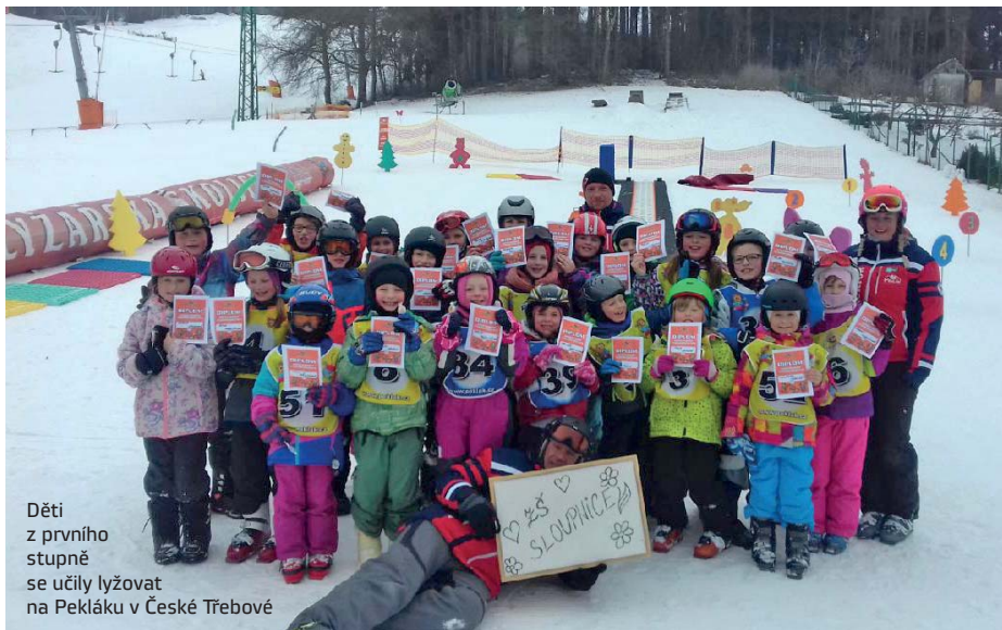
Děti z prvního stupně se učily lyžovat na Pekláku v České Třebové