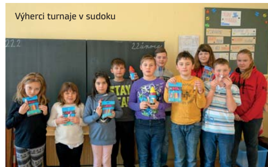
Výherci turnaje v sudoku