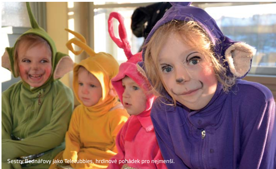
Sestry Bednářovy jako Teletubbies, hrdinové pohádek pro nejmenší.