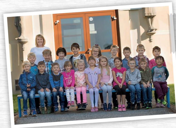
← 1. třída Školní rok 2020–2021

Moje děti už jsou starší, u nich probíhala výuka trochu jinak, takže jejich zkušenosti nebyly pro prvňáčky přenositelné.